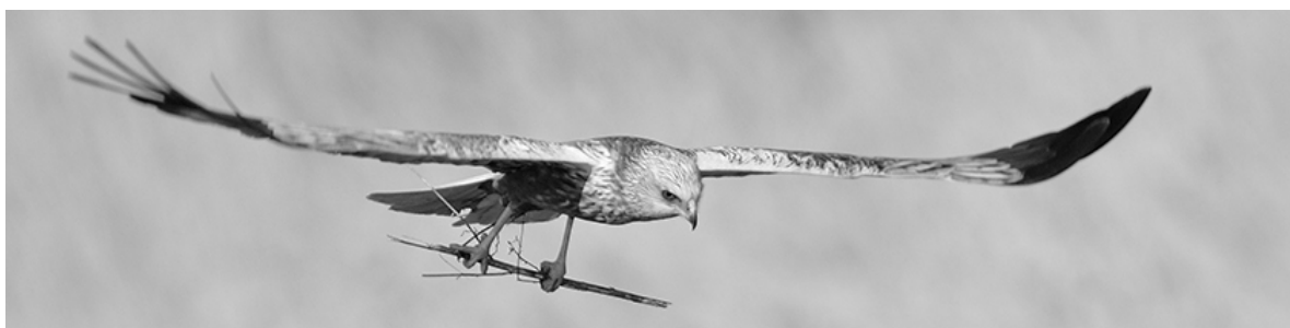
Bruine kiekendief – Johan Geyskens

Het lidgeld werd in 2010 behouden en bedraagt €8,50. Met dit lidgeld kunnen we de onkosten van de nieuwsbrieven en het jaarboek dekken (wat ook onze bedoeling is). Onze ereleden zorgen voor een extra steun die we in de werking van de vereniging en het bosmuseum goed kunnen gebruiken. Na jaren lang (sinds 2002) ons lidgeld ongewijzigd gehouden te hebben werd voor 2011 het lidgeld opgetrokken tot €10.